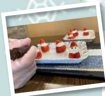
かわいいクリスマスケーキ の出来上がり☆