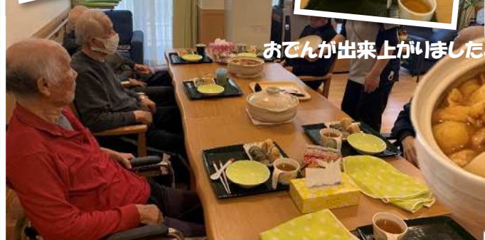
おでんが出来上がりましたよ!