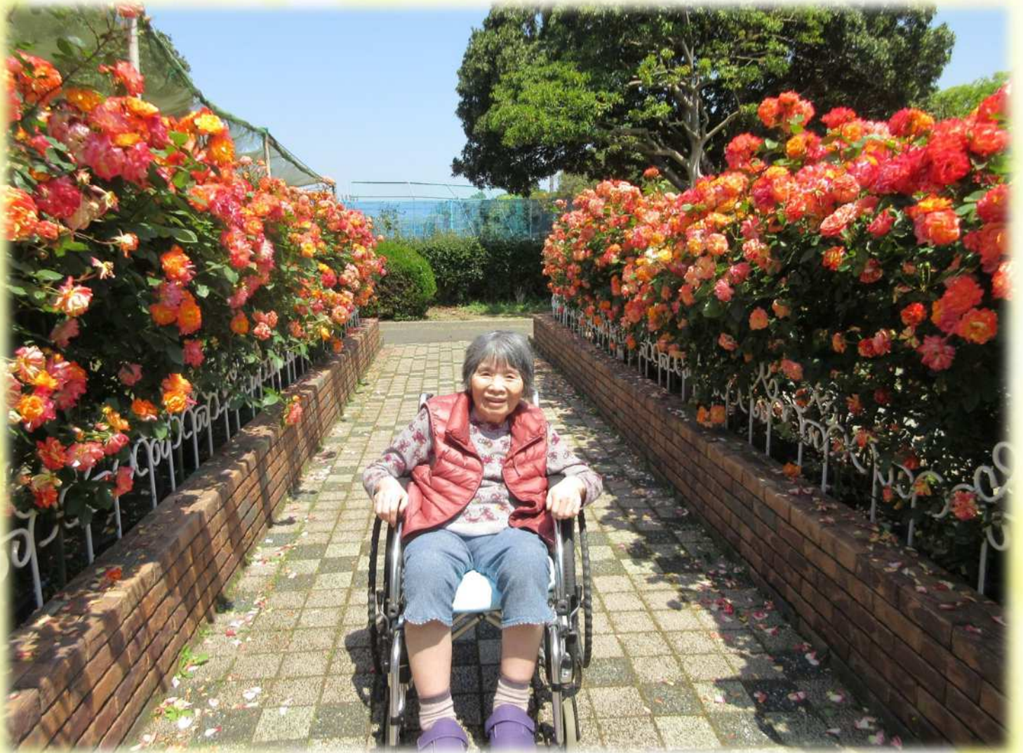
特別養護老人ホーム:しあわせの家 バラ園にて