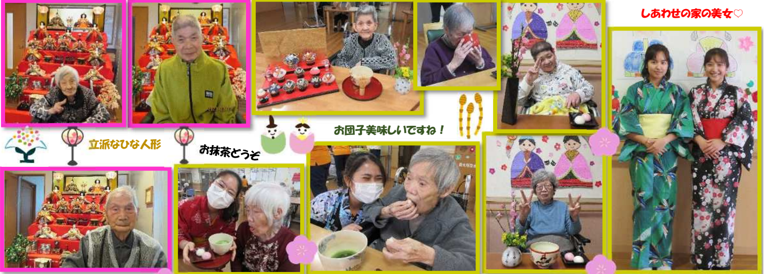
しあわせの家の美女♡