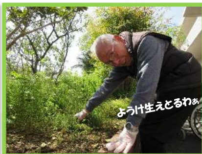
ようけ生えとるわあ