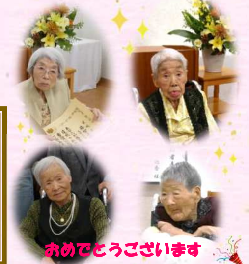
おめでとうございます