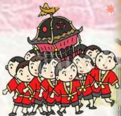
江ノ元八幡丸太鼓台