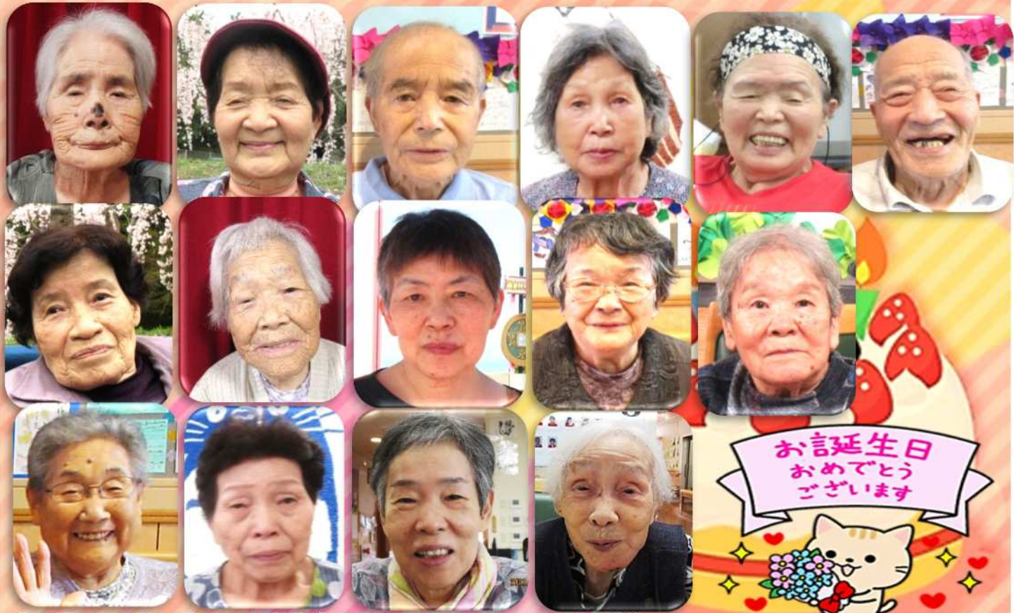
9月～11月にお誕生日を迎えられた皆様