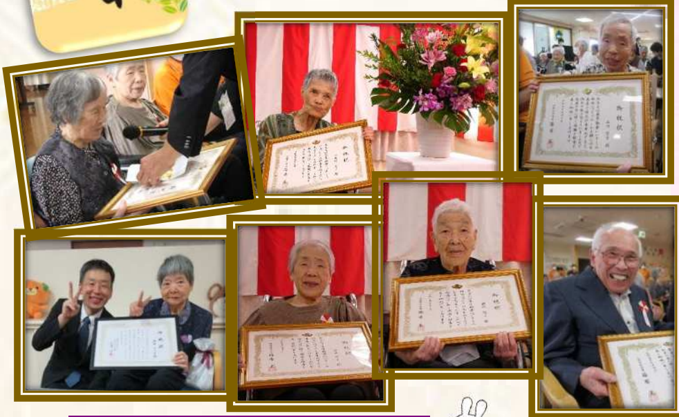
「百寿」の高齢者表彰を受けられた皆様

9月7日に敬老会が行われ、今年は過去最高！総勢24名の入所者様に、四国中央市からお祝い状が送られました。今年はコロナ前と同じようにご家族様にもご参加いただき、盛大にお祝いすることができました。この日の昼食にはお祝い膳をいただきました。また、9月20日には高齢者表彰式も行われ、4名の方が内閣総理大臣・愛媛県知事より長寿のお祝い状と記念品が送られました。皆さん、これからも元気にお過ごしください。