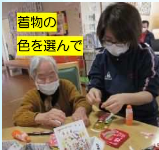
着物の色を選んで