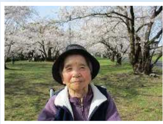
桜は日本人の心 癒されるよね～