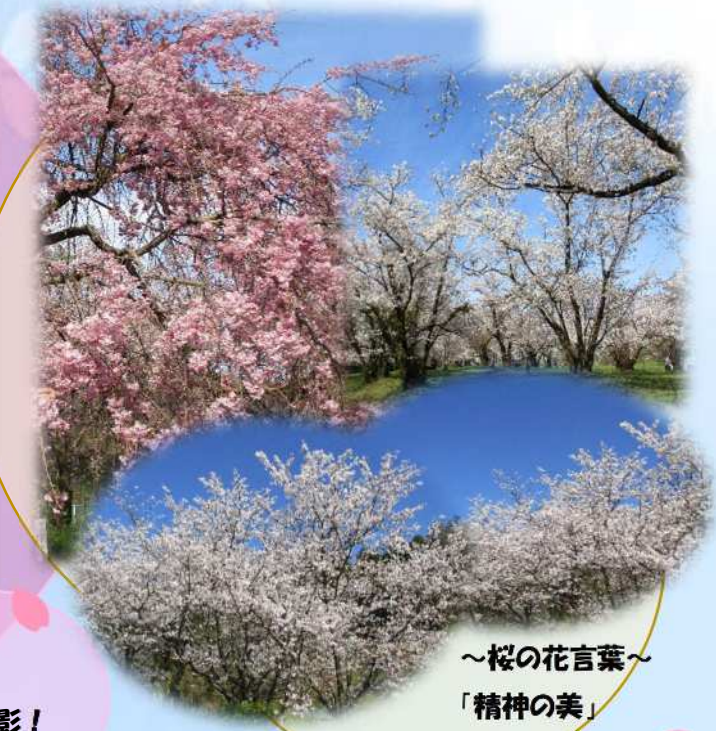
～桜の花言葉～ 「精神の美」 「優美な女性」