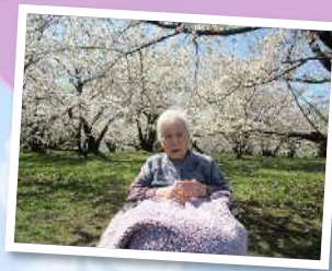
花冷えのため、肩から 毛布をかけて、記念撮影！ いい笑顔です。