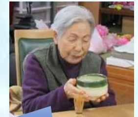
ごちそうさまでした