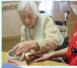
美味しくできました