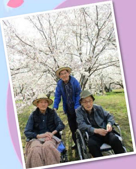
満開の桜をバックに 3人で仲良くパチリ！ 帽子が良く似合っ ますね。

お花見は、すすぎヶ原入野公園・新長谷寺に行き、満開の桜の下で記念撮影！ 青空の下で見る桜は、どのスポットも圧巻の美しさでした。