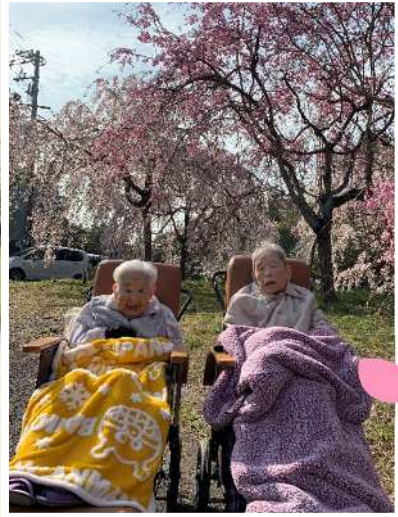
新長谷寺の枝垂れ桜の下で撮影。 久しぶりの外出で、 春の空気や満開の桜を満喫 (^^)