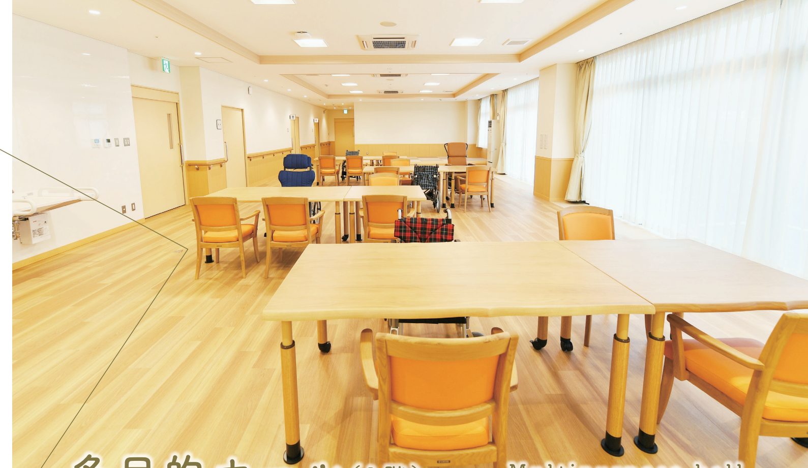
多目的ホール(1階) Multipurpose hall

イベントの開催、地域の皆様との交流ができるパブリックスペース。 カラオケ設備も完備しています。