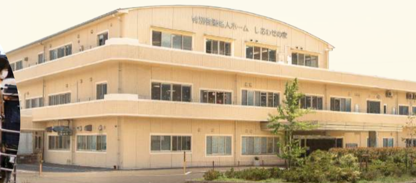
社会福祉法人まこと