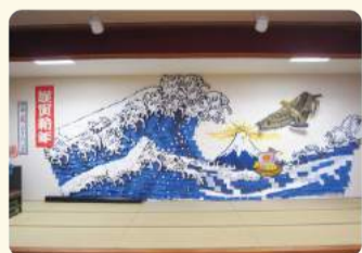
ご利用者制作の壁画 6m×2.5mの大作です!