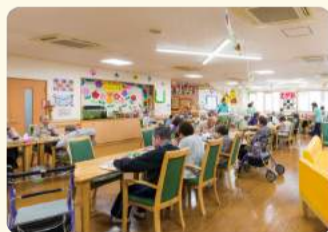
デイサービスの日常